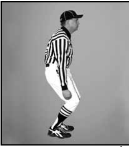
BLOPAGE PAR DERRIÈRE Taper l'arrière des genoux avec les mains