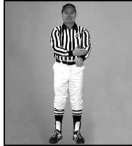
EXPULSION Action de trancher le poignet