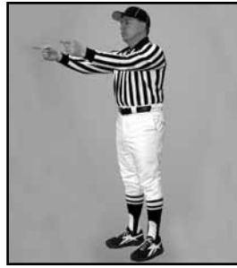
VAINQUEUR DU TIRAGE AU SORT Pointer avec les deux bras en direction de l'équipe qui a gagné le tirage au sort