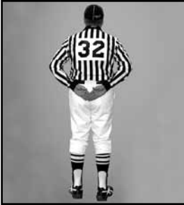
RETARDER LA PARTIE Mettre les mains derrière le dos