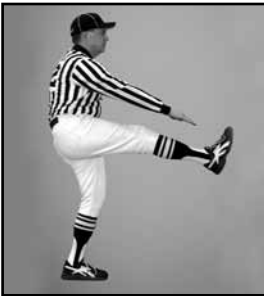
CONTACT AVEC LE BOTTEUR Lever et toucher le bas d'une jambe