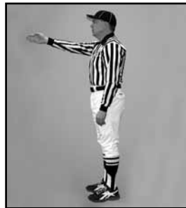
PREMIER ESSAI Pointer avec le bras tendu vers l'avant