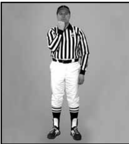
PROTECTEUR FACIAL Imitation du geste du joueur