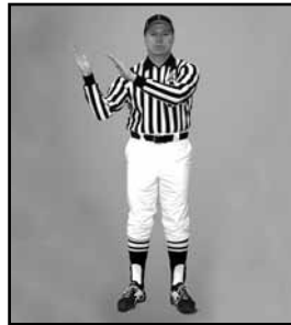
BLOC AUX GENOUX Faire une action de couper à l'horizontal